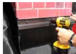
Schritt 7 - zusätzliche Sicherung mit MAGE Flex-Abschlussleiste - Befestigung mit Spengler- schrauben und Dübeln