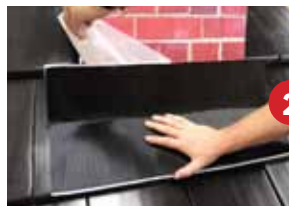
Schritt 2 - seitlichen Überstand hoch- stellen - Schutzfolie erst vom oberen Klebestreifen, dann vom unteren entfernen und anformen