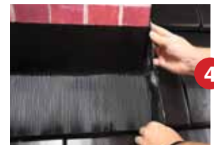
Schritt 4 - Aufkantung für den Seitenstreifen herstellen