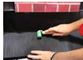
Schritt 3 - Anformung am Deckmate- rial mit Andrückrolle