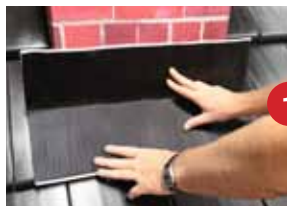
Schritt 1 Kaminvorderseite/ Brustseite

MAGE Zubehör: MAGE Flex - Abschlussleisten, MAGE Dachdichtstoff, Spenglerschrauben