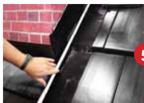
Schritt 5 - Seitenstreifen auf Mindest- länge (+25 cm) zuschneiden - erforderliche Anschlusshö- he abbiegen - Fixierung von unten nach oben