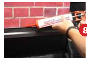
Schritt 8 - Fugen mit MAGE Dachdichtstoff schließen