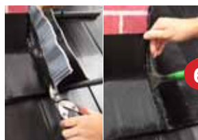
Schritt 6 Eckausbildung - seitlichen Anschluss bis max. 2 cm höher als Brustseite abschneiden - Stehfalz andrücken