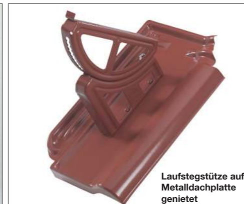
Laufstegstütze auf Metalldachplatte genietet