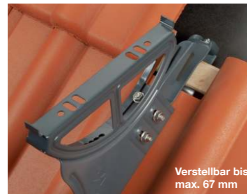
Verstellbar bis max. 67 mm

Alle Forderungen der - Europäischen Norm EN 516 - DIN 18160, Teil 5 - Sicherheitsregeln für Schornsteinfegerarbeiten werden voll erfüllt