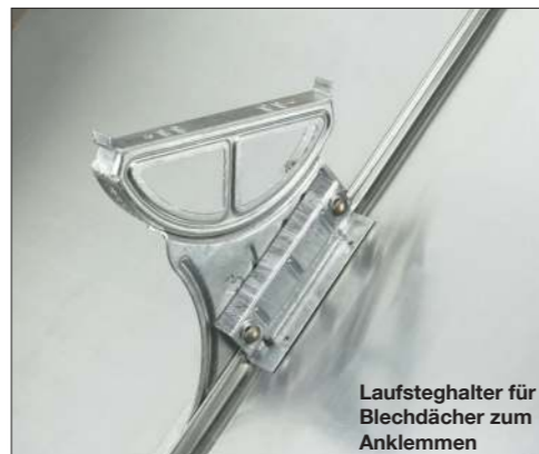
Laufsteghalter für Blechdächer zum Anklemmen