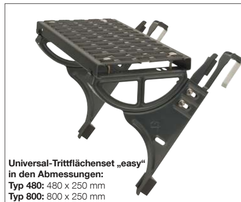
Universal-Trittflächenset „easy“ in den Abmessungen: Typ 480: 480 x 250 mm Typ 800: 800 x 250 mm